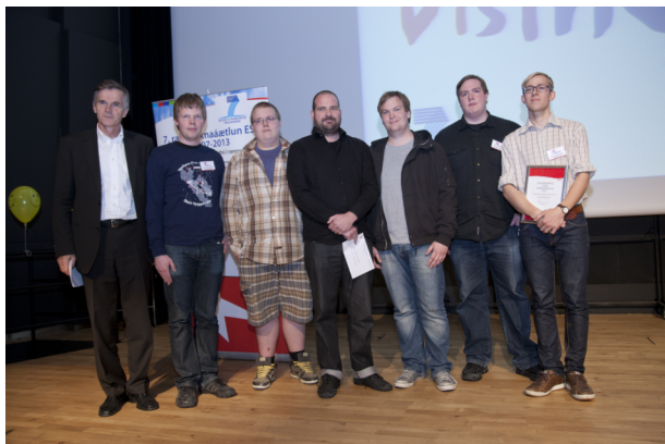
Félagar taka við viðurkenningu á Vísindavöku.

Stjörnuskoðunarfélagið og Stjörnufræðivefurinn hlutu í haust báðar helstu viðurkenningarnar sem eru í boði fyrir störf á sviði vísindamiðlunar. Á Vísindavöku í september fengu þessir aðilar viðurkenningu fyrir vísindamiðlun frá Rannsóknamiðstöð Íslands (RANNÍS). Síðari viðurkenningin var Fræðslu- og vísindaviðurkenning Siðmenntar, félags siðrænna húmanista á Íslandi.